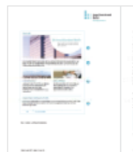
Das Redaktionshandbuch gibt Anleitungen zur Contenterstellung

Die Produktnamen sind im Fließtext grundsätzlich in Anführungsstriche zu setzen. Eine Liste aller Produktbezeichnungen bzw. deren Schreibweisen befindet sich im Anhang .